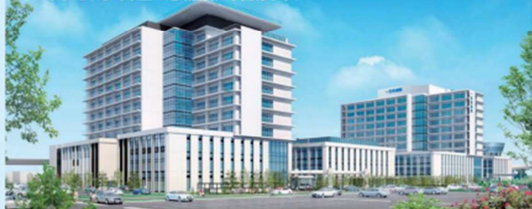
▲一宮西病院・新館B棟完成イメージ。屋上ヘリポートでドクターヘリの着陸も可能。

一宮西病院は現所在地の南側敷地に、現在の建物と同規模の新館B棟を増築します(2023年竣工予定)。完成後の一宮西病院の総敷地面積・延べ床面積はともに約2倍、ベッド数は約1.6倍(497床→801床)となり、医療法人としては県下最大規模の病院になります。予防から救急・急性期、リハビリテーション、在宅復帰支援まで、「垣根のない医療」を提供できるようになり、これまで以上に地域医療へ貢献します。