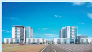
▲イメージ内、左の建物が増築部分。