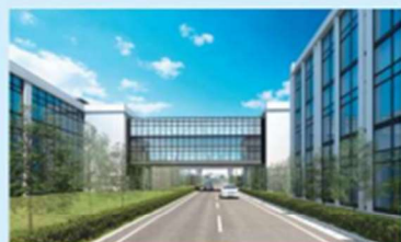
▲上空通路で既存建物とB棟を接続。