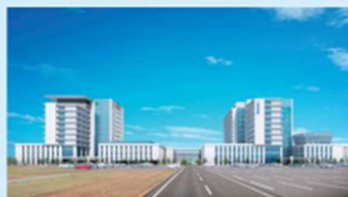
▲イメージ内、左の建物が増築部分。