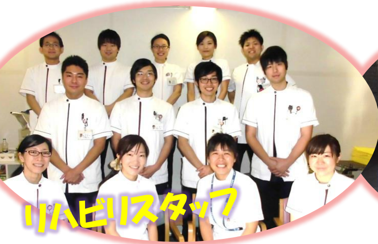
リハビリスタッフ

その他、入浴装置を1台増台、送迎車も2台増車! より厚いサービスをご提供いたします!!